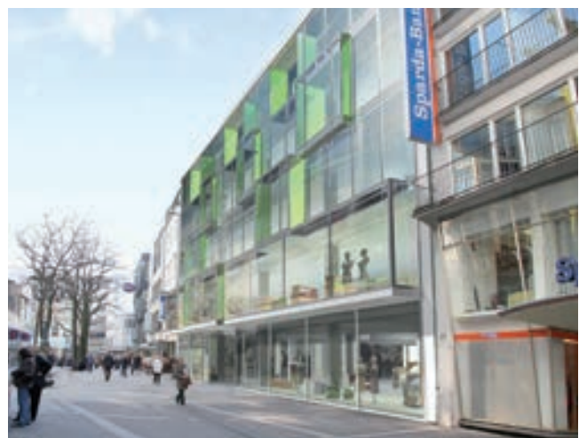
Architektur: Figge Architekten, Wuppertal